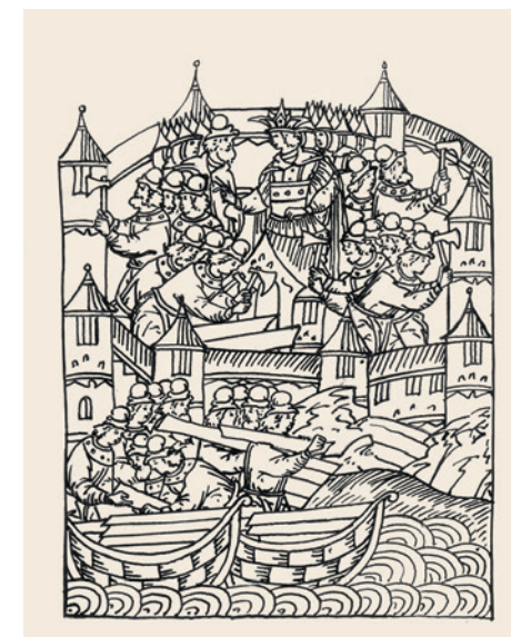
Постройка Свяжска Миниатюра